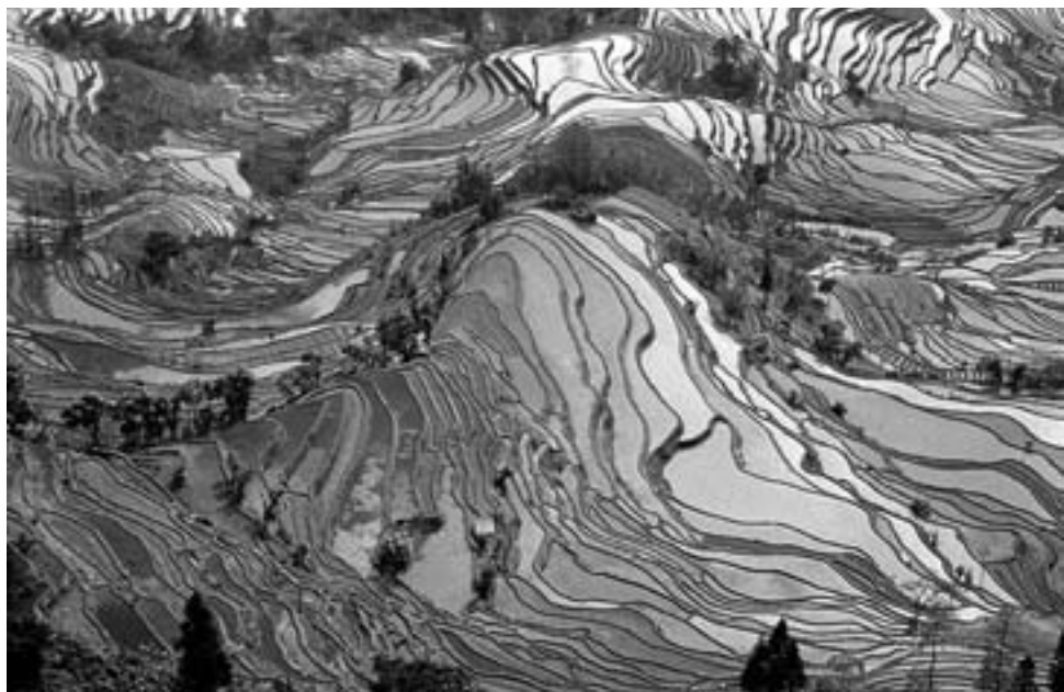
Rýžová pole v Jün-nanu

a Ming se nová technika rozšířila i do méně rozvinutých oblastí provincie An-chuej a do nížin při Žluté řece. V 17. a 18. století se tato inovace konečně prosadila také v centrální Číně, v S'-čchuanu i v hraničních oblastech jižní a jihozápadní Číny.